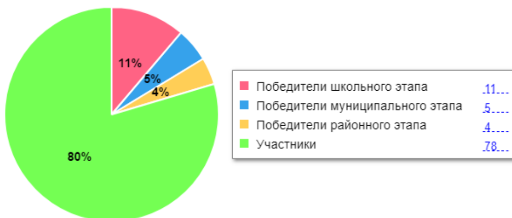
Диаграмма по результатам участия школьников во ВсОШ

В 2023 году был проанализирован объем участников конкурсных мероприятий разных уровней. Дистанционные формы работы с учащимися, создание условий для проявления их познавательной активности позволили принимать активное участие в дистанционных конкурсах регионального, всероссийского и международного уровней. Результат – положительная динамика участия в олимпиадах и конкурсах, привлечение к участию в интеллектуальных соревнованиях большего количества обучающихся Школы.